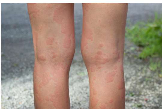
Фото: кропивниця на тильній стороні ніг..

Гостра кропивниця може виникнути у всіх вікових групах як у чоловіків, так і у жінок. Приблизно 15-20 % населення в той чи інший момент життя відчувають гостру кропивницю.