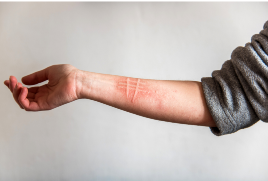
Фото: ангіоневротичний набряк обличчя (ліворуч), кропивниця, спричинена розчісуванням (дермографізм) (праворуч).