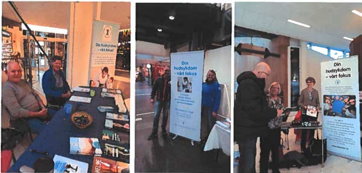
Fra ulike WPD-stands rundt omkring i landet.