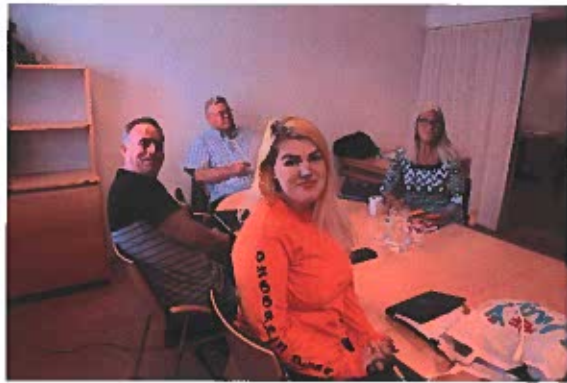
Likepersonsutvalget og Artrittutvalget i PEF.