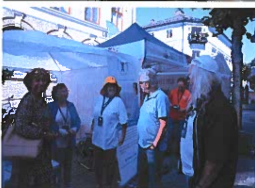
Møtet med helsepolitiker Ingvild Kjerkol, på høring i Stortinget og debatt og stand på Arendalsuka.

Arendalsuka 2019 ble arrangert fra 12. til 16. august. PEF hadde bemannet stand under hele Arendalsuka. PEF-ung arrangerte et seminar under Arendalsuka hvor blant andre leder av Stortingets Helse- og omsorgskomiteé, Geir Jørgen Bekkevold fra KrF deltok. Tema for seminaret psykiske utfordringer som ung hudpasient.