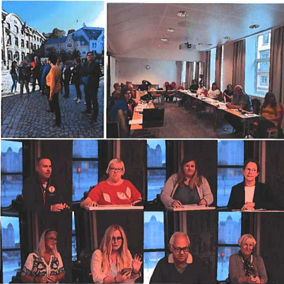
PEF arrangerte mange ulike typer kurs i 2019.