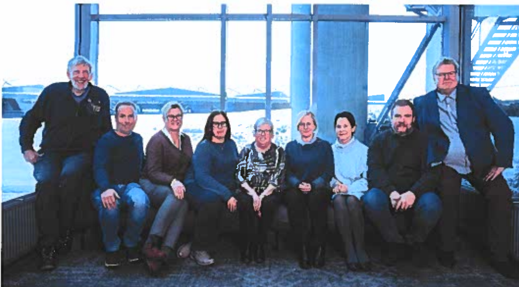
Sentralstyret i Psoriasis- og eksemforbundet i 2019.