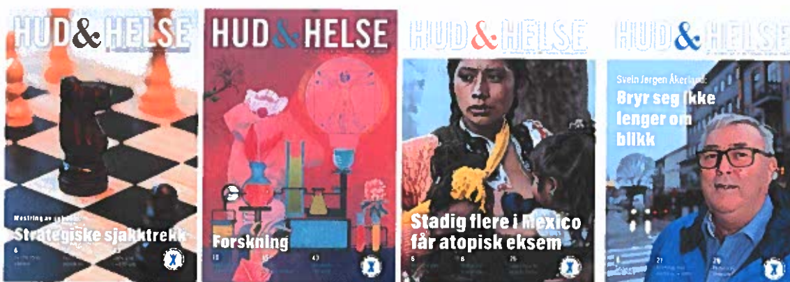
De fire utgavene av Hud & Helse i 2019.