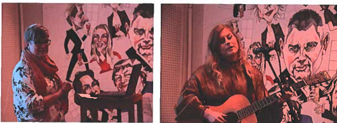
Fra kveldsmøtet på Litteraturhuset i Oslo på Verdens psoriasisdag.

Årets tema for psoriasisdagen var «Connected – or be connected», og psoriasisdagen ble brukt til å vise de ulike alvorlige aspektene og øke forståelsen for at psoriasis er mye mer enn utslett på huden, og hvor samhold er viktig. PEF og PEF-ung var aktive i medier som en del av markeringen av disse temaene.