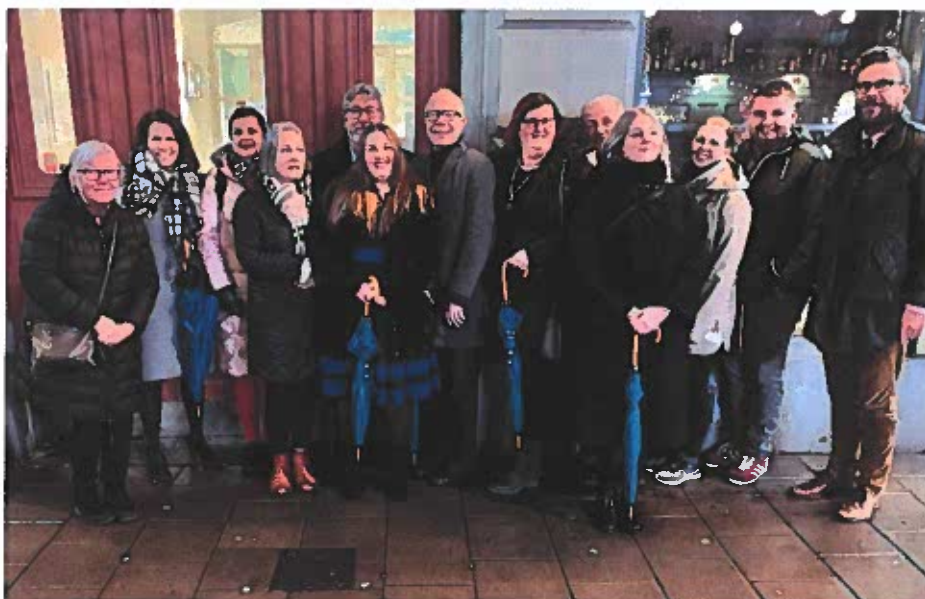
Styremøte i NORDPSO i april.