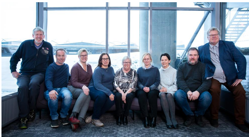
Sentralstyret i Psoriasis- og eksemlforbundet 2018-2021.